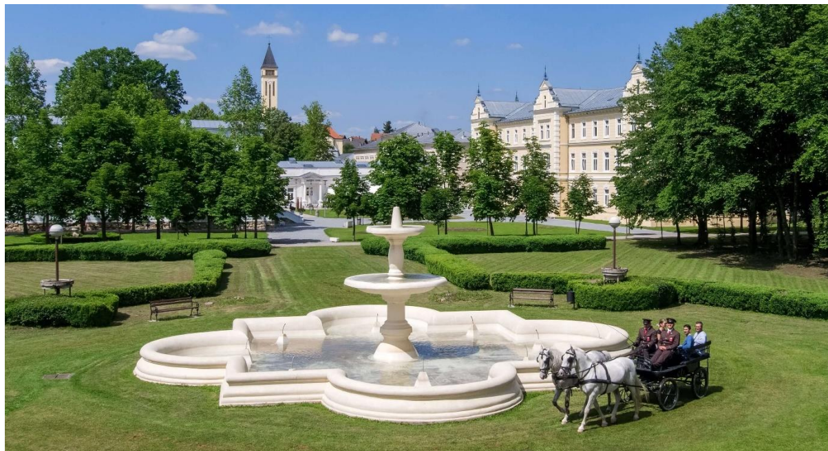
Lipik, prosinac 2021.